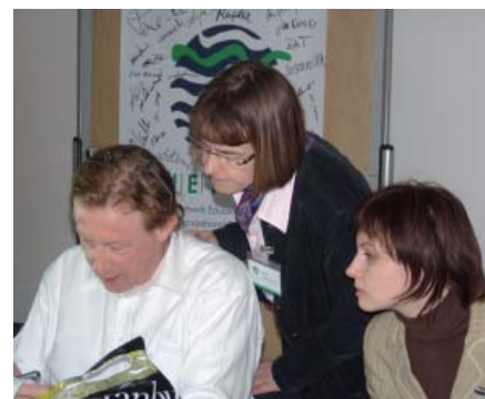
Terzo incontro di lavoro a Praga: Elaborazione dello standard ENETOSH

In collaborazione con il Politecnico di Dresda, lo standard verrà continuamente aggiornato.