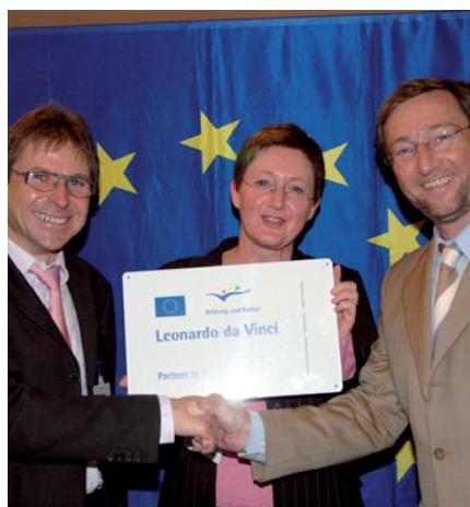
2005: Firma ufficiale del contratto presso l'Agenzia Nazionale Istruzione per l'Europa

Il numero delle visite sulla piattaforma internet ENETOSH durante tutto il percorso del progetto è andato continuamente aumentando. Allo stesso momento però scende il numero delle pagine visitate e il tempo di consultazione della singola pagina. Mentre nel 2007, 12.300 persone hanno visitato il sito ENETOSH, nei primi sei mesi dopo la conclusione del progetto, il numero è aumentato a 24.986 visitatori diversi.